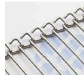
Single Loop Edge™