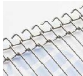
Double Loop Edge™